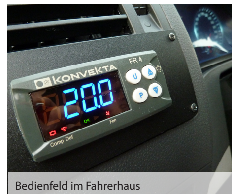
Bedienfeld im Fahrerhaus