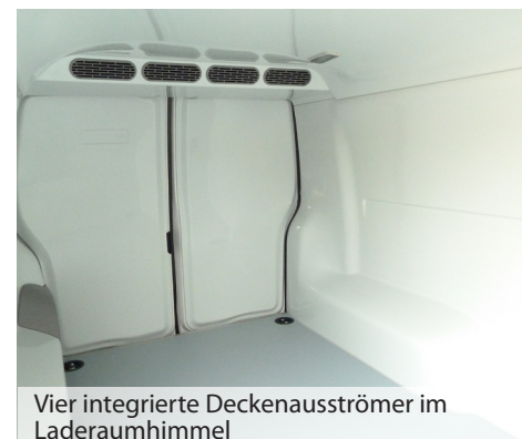
Vier integrierte Deckenausströmer im Laderaumhimmel