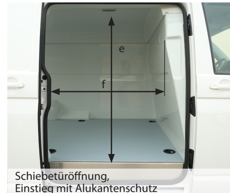
Schiebetüröffnung, Einstieg mit Alukantenschutz