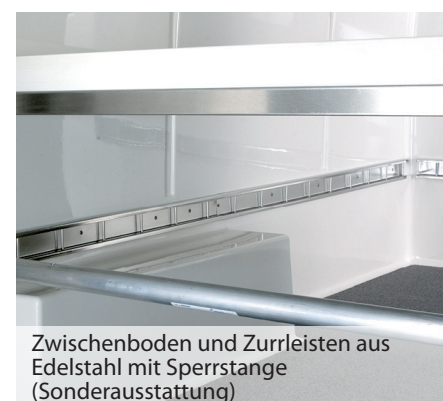
Zwischenboden und Zurrleisten aus Edelstahl mit Sperrstange (Sonderausstattung)

Sämtliche Angaben in diesem Prospekt entsprechen dem zum Zeitpunkt des Drucks vorhandenen Kenntnisstand. Sie können sich bis zum Kauf ändern. Die teilweise in den Abbildungen gezeigten Sonderausstattungen gehören nicht zum serienmäßigen Lieferumfang. Änderungen vorbehalten. Stand November 2011. Printed in Germany.