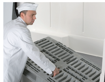
Palettenbreite an der Schiebetür (Radstand 3.665mm & 4.325mm)