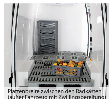
Plattenbreite zwischen den Radkästen (außer Fahrzeug mit Zwillingbereifung)

* gemessen bei +30° Außentemperatur und 0° Innentemperatur