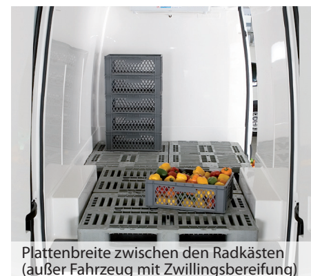
Plattenbreite zwischen den Radkästen (außer Fahrzeug mit Zwillingbereifung)