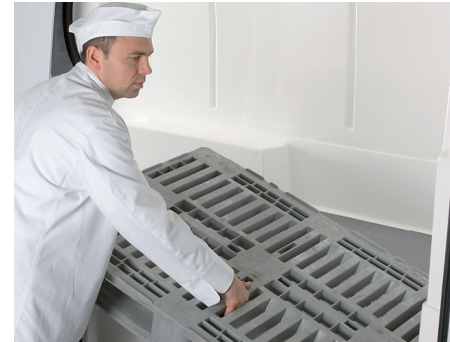
Palettenbreite an der Schiebetür (Radstand 3.665mm & 4.325mm)