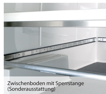
Zwischenboden mit Sperrstange (Sonderausstattung)

Sämtliche Angaben in diesem Prospekt entsprechen dem zum Zeitpunkt des Drucks vorhandenen Kenntnisstand. Sie können sich bis zum Kauf ändern. Die teilweise in den Abbildungen gezeigten Sonderausstattungen gehören nicht zum serienmäßigen Lieferumfang. Änderungen vorbehalten. Stand Dezember 2011. Printed in Germany.